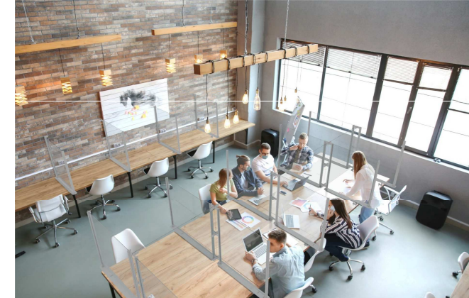
Espace collaboratif repensé avec « boîtes » individuelles pour s'isoler